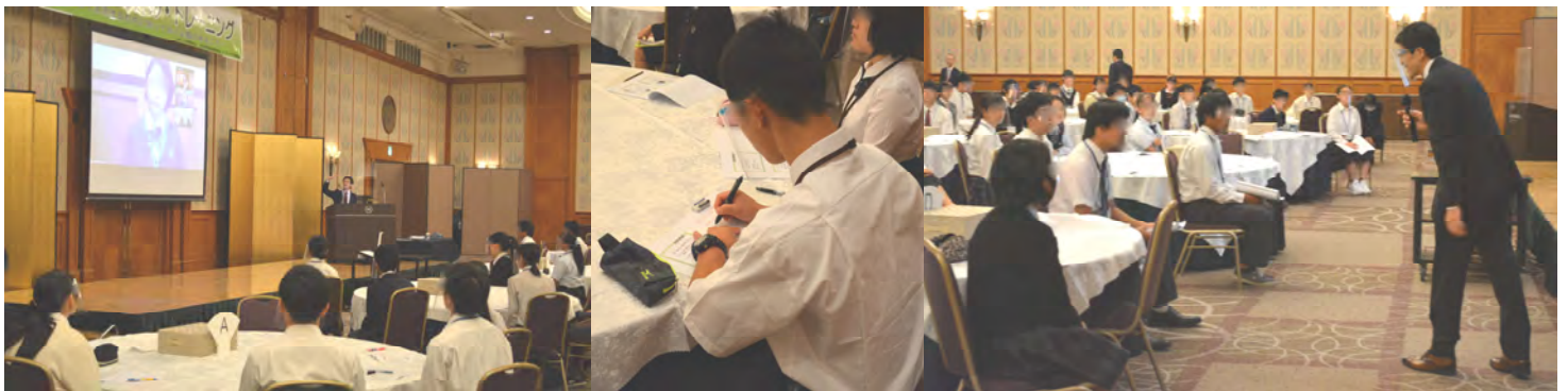
講義:「新しい生活様式での『話し方』 オンライン面接で、相手に好印象を与える『話し方』を教えて頂きました。