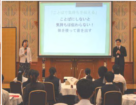
講義:「ことばを使って気持ちを伝えよう」 相手が聞きとりやすい『話し方』を学びました。