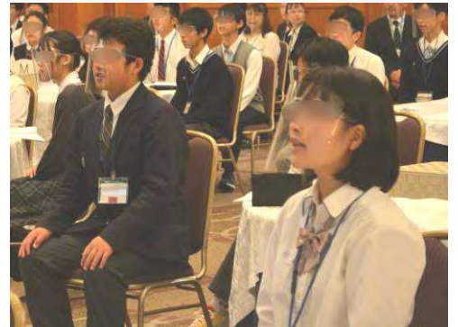
実習:「あいさつをしてみよう」 相手に届くように声の出し方を意識して 何度も練習しました。