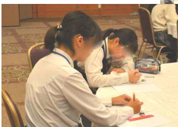
実習:「オンライン面接を体験してみよう」