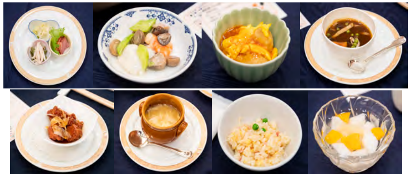
「中国料理 四川」の豪華な料理