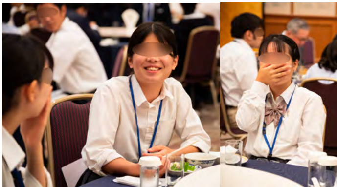
和やかな雰囲気の中、美味しい中華料理を 頂き、会話も弾みました。

テーブルマナー実習はソーシャルディスタンスを保ち、いい緊張感をもって学ぶことができました。 講師の先生の丁寧な説明のおかげでわかりやすく、スムーズに実践しています。