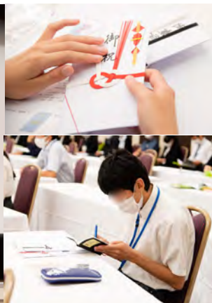
講義・実習③: 祝儀・不祝儀袋の使い方 (祝儀袋にもマナーがある事を知り、すぐにメモを取りました。)