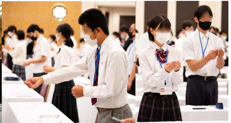
頂いた名刺の会社名や名前を手で隠さない様に丁寧に受取ります。