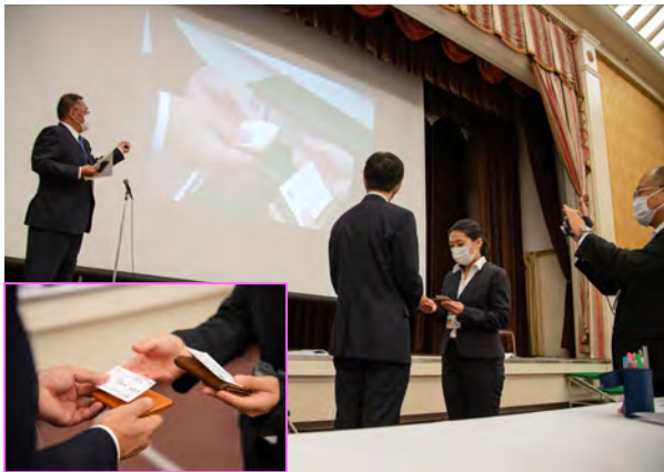
実習②: 正しい名刺交換の仕方