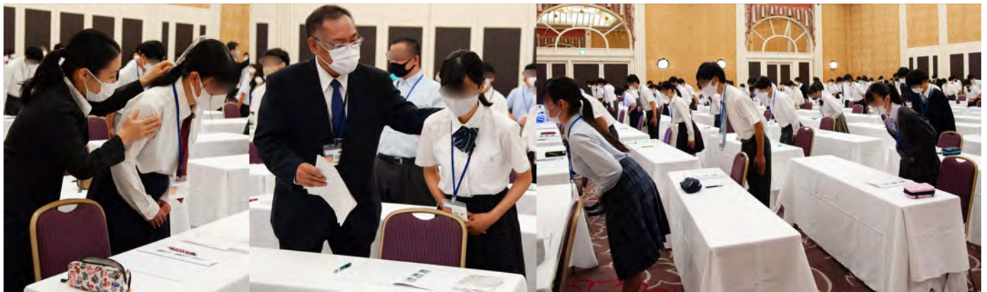
実習①: 美しいお辞儀 (きれいなお辞儀ができていないか講師の先生方が一人一人チェック!)