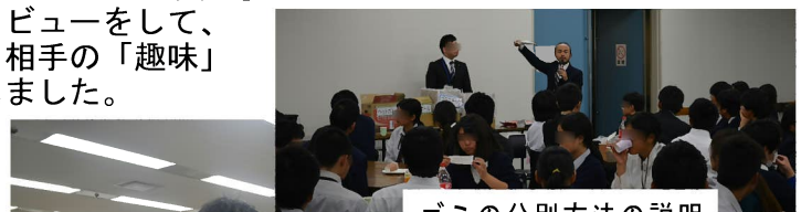
ゴミの分別方法の説明