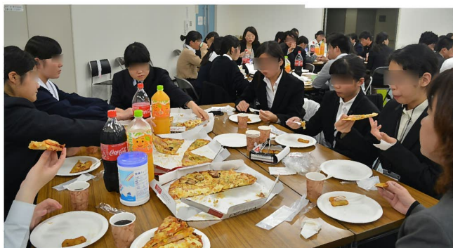
「昼食は熱々の大きなピザに、ポテトフライ!初めて 大きなピザを食べた子どもたちはお腹一杯で大満足です。」