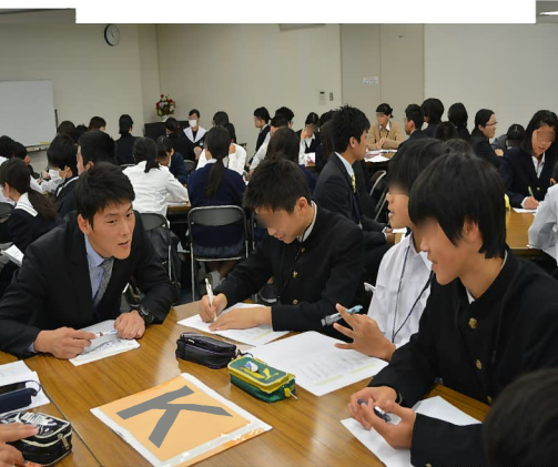
実習:「さあ、話してみよう!(インタビュー実習)」 初対面の人にインタビューをして、 上手に会話を広げ、相手の「趣味」 を聞き出す練習をしました。