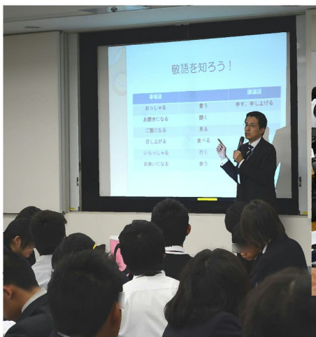
講義:「敬語を知ろう!」