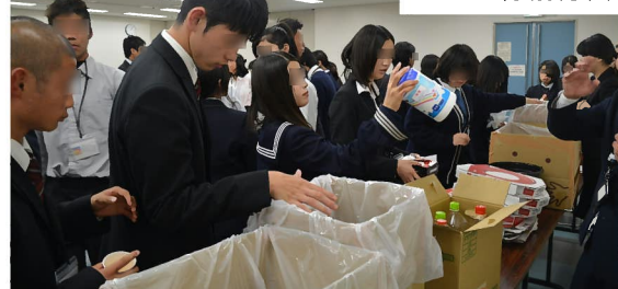
実習:自分たちでゴミを分別して捨てました。