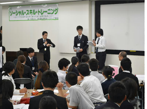
「インタビューした内容を1分にまとめ、 みんなの前で発表しました。」