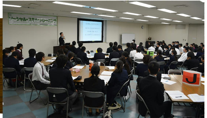
講義:「なぜ話し方を学ぶのか」 「話すうえで大切なこと」