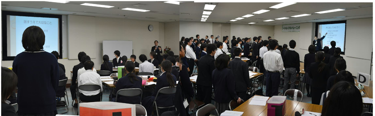
実習:「声に出してみよう!」:相手に届くように声を出す練習を何度もしました。